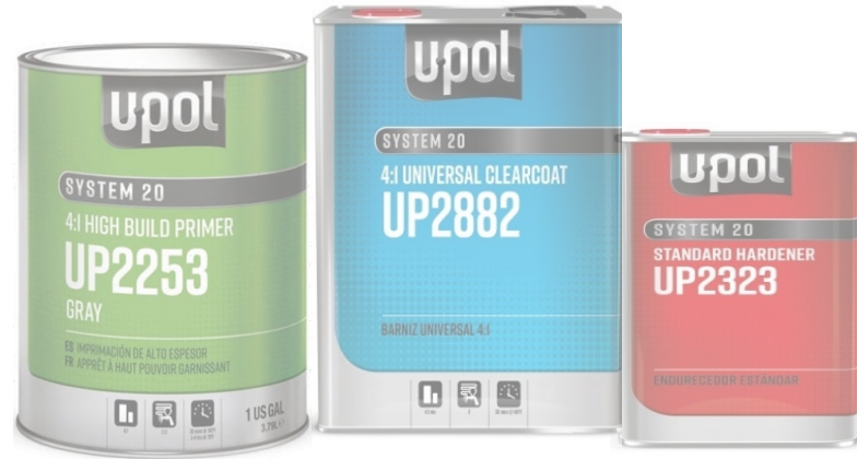
Transparentes y Imprimaciones