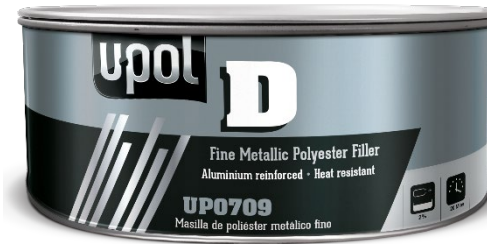
UP0709 "D" Metallic Filler