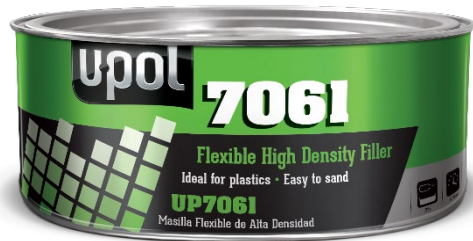
UP7061 Flexible Filler