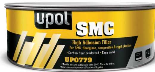
UP0777 / 779 SMC Filler