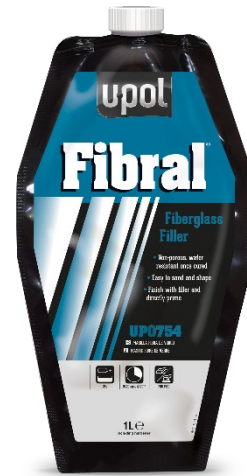
UP0717 / 753 / 754 El producto mayor de U-POL, Fibral