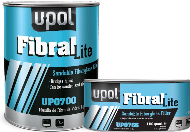
UP0700 / 766 Fibral Lite