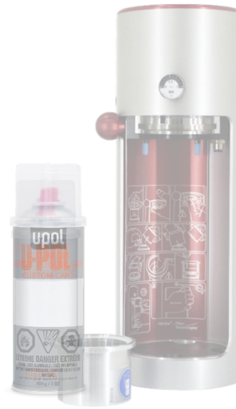
Latas de Aerosoles Para Llenar